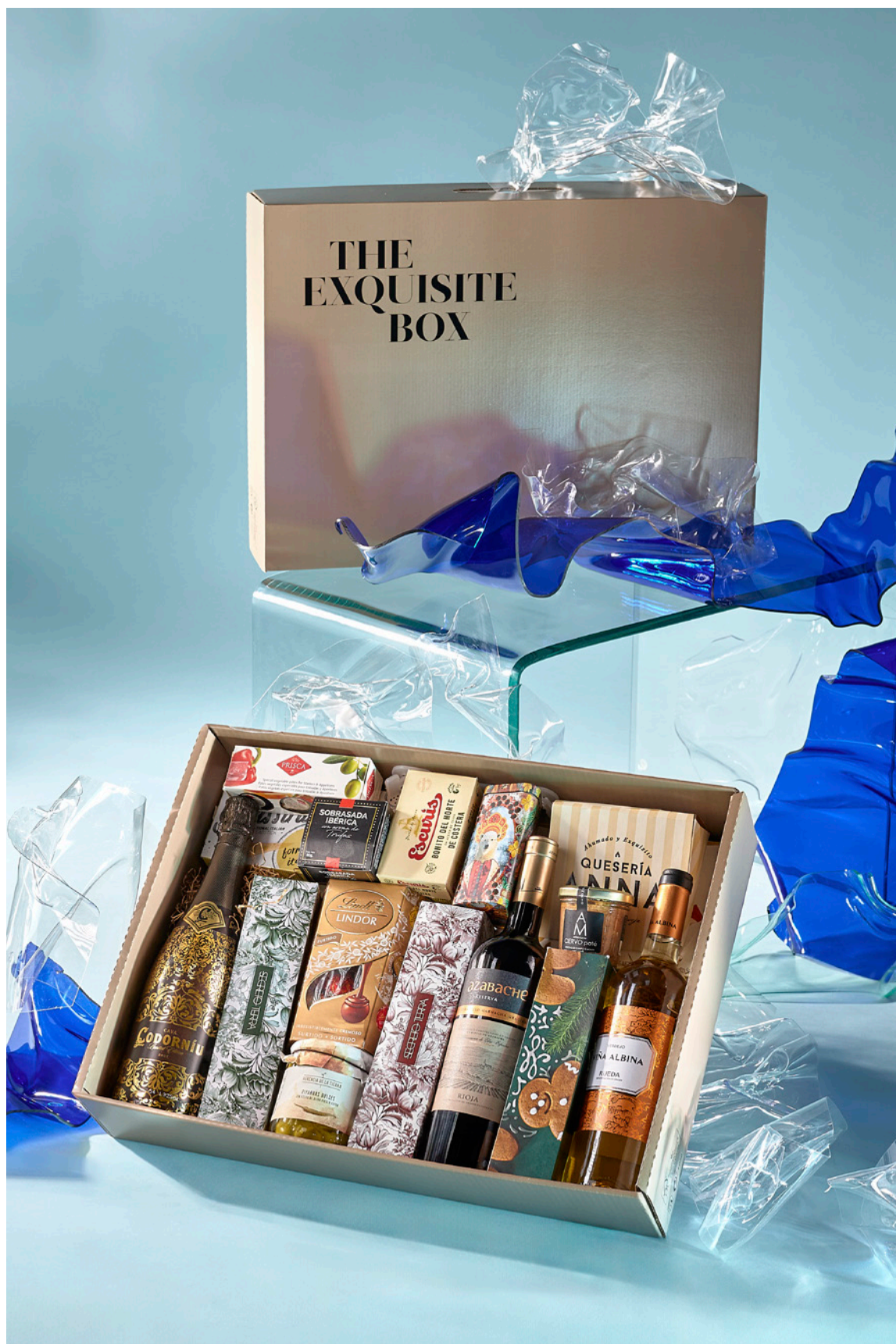
LOTE THE EXQUISITE BOX 317 REF. 4D2CTEB317