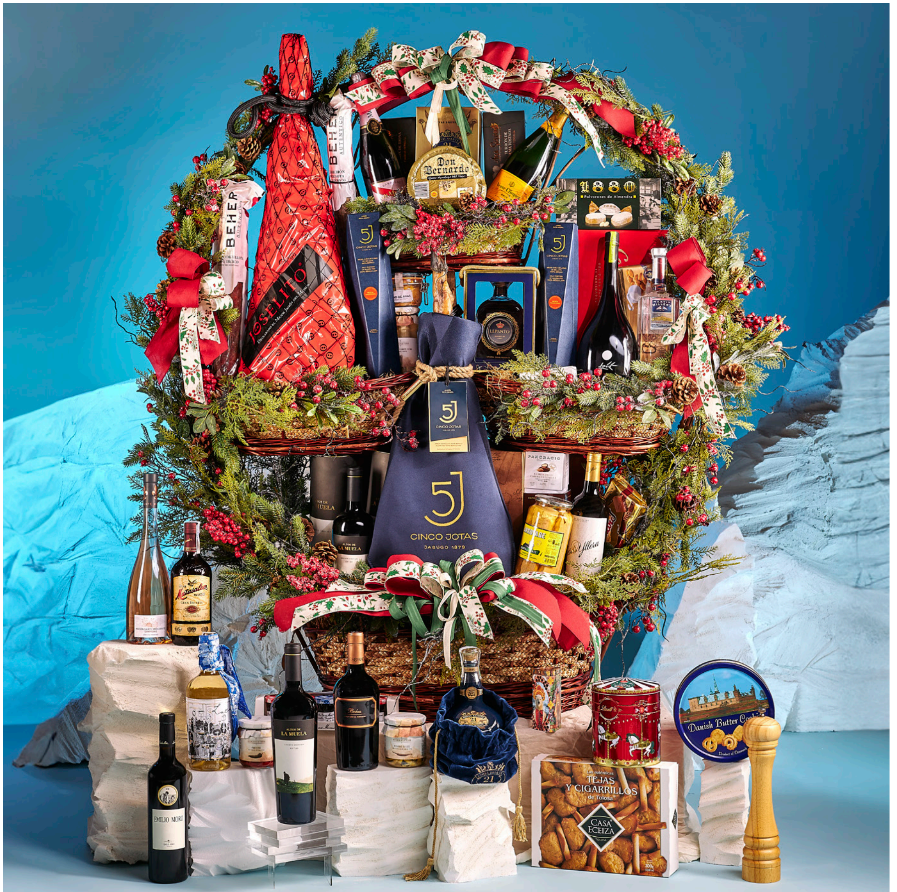
La cesta 512 se presenta decorada con cintas y envuelta en tul.