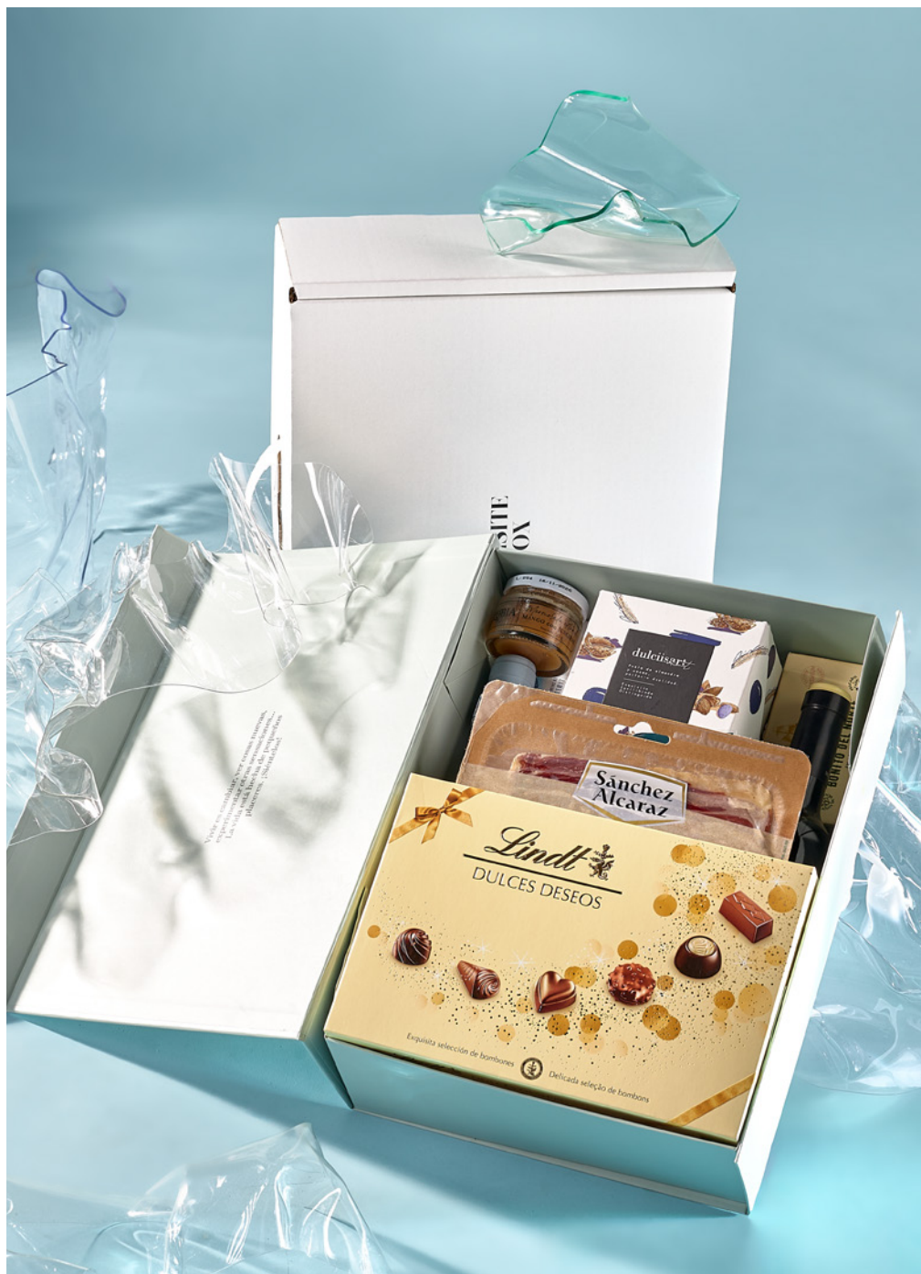
CAJA LUJO THE EXQUISITE BOX 321 REF. 4D2CTEB321