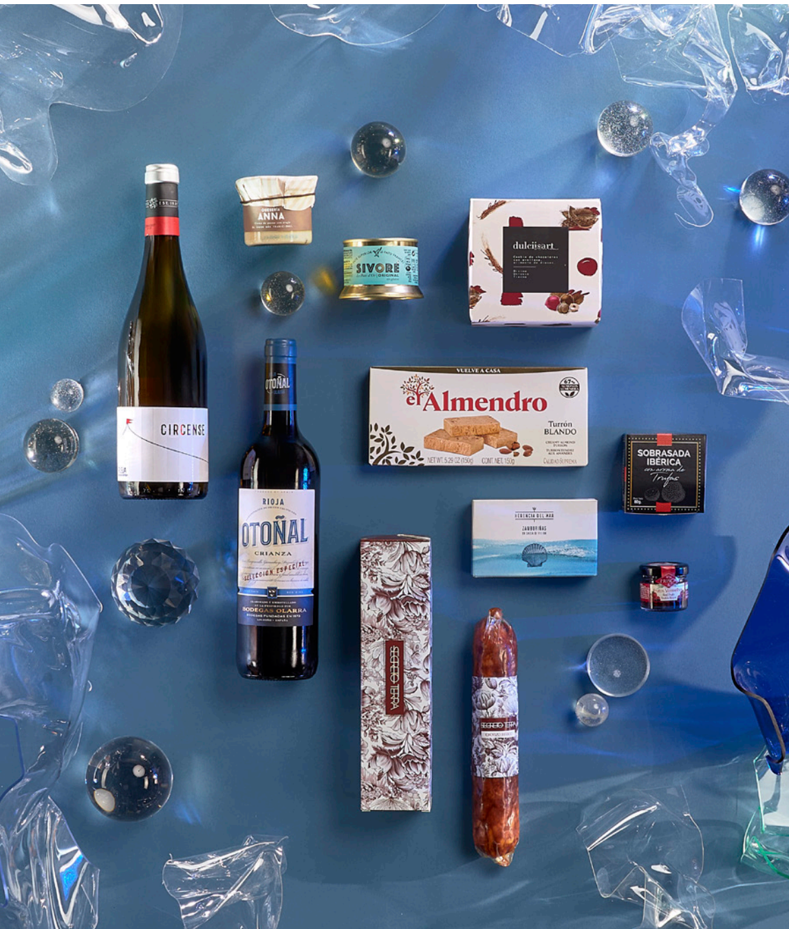
LOTE THE EXQUISITE BOX 325 REF. 4D2CTEB325