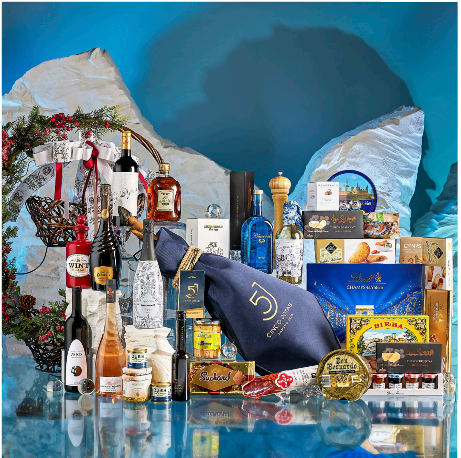
La cesta 510 se presenta decorada con cintas y envuelta en tul.