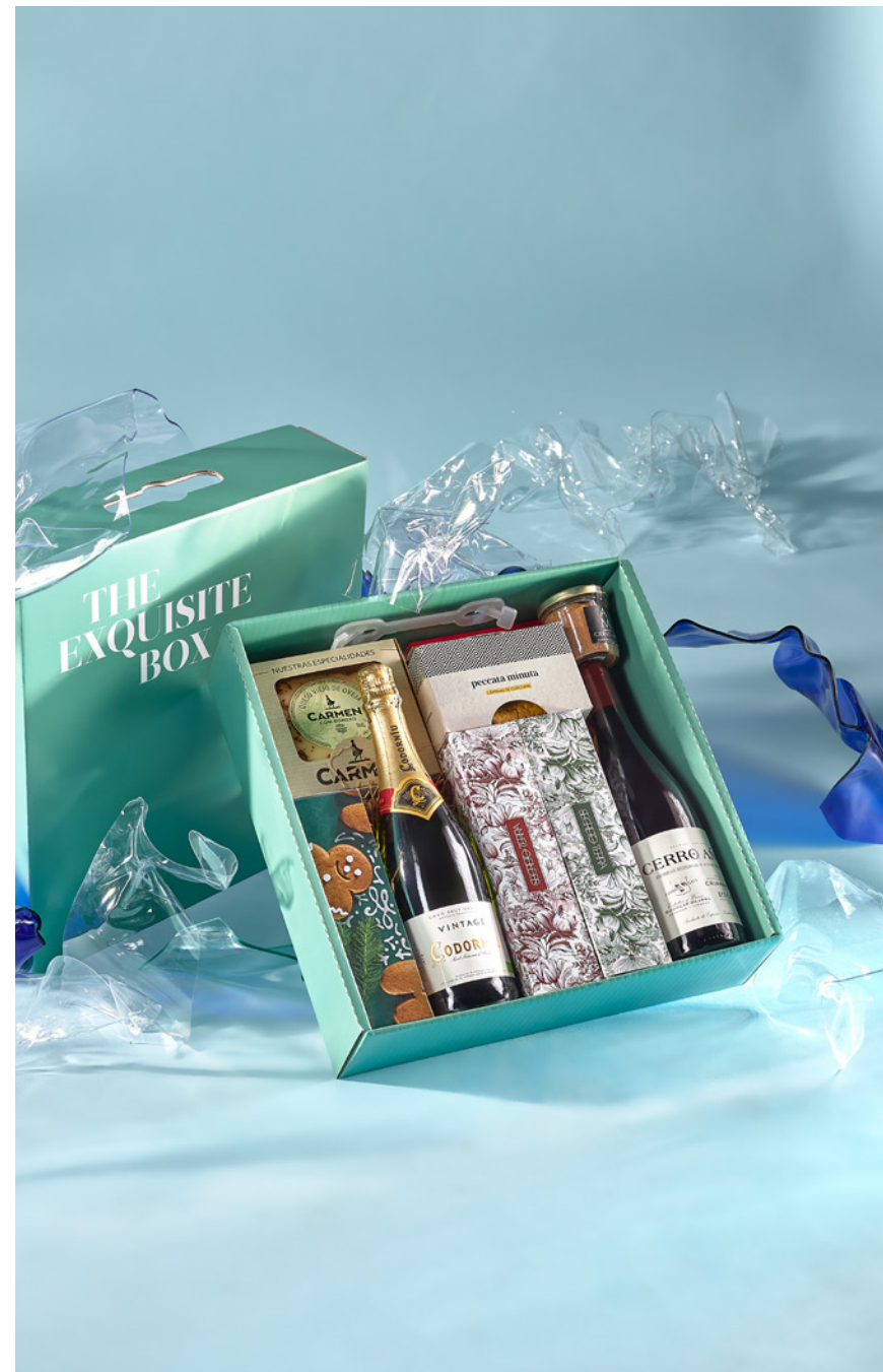
LOTE THE EXQUISITE BOX 324 REF. 4D2CTEB324