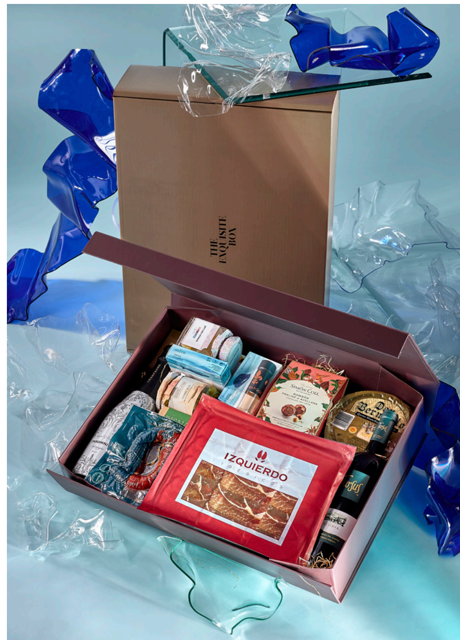
CAJA LUJO THE EXQUISITE BOX 306 REF. 4D2CTEB306