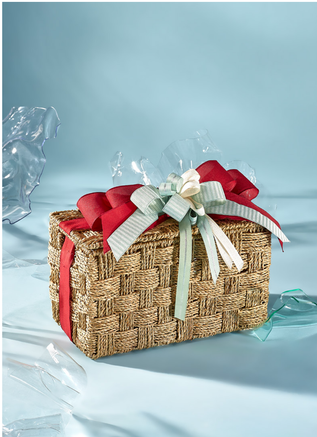
BAÚL THE EXQUISITE BOX 323 REF. 4D2CTEB323

Incluye baúl decorado y caja protectora de embalaje.