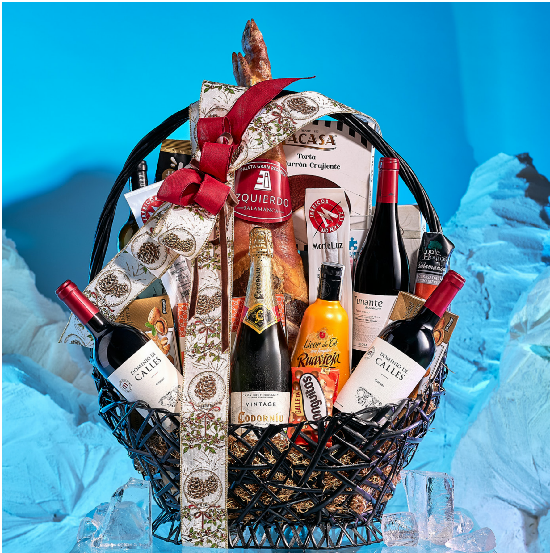
La cesta 502 se presenta decorada con cintas y envuelta en tul.