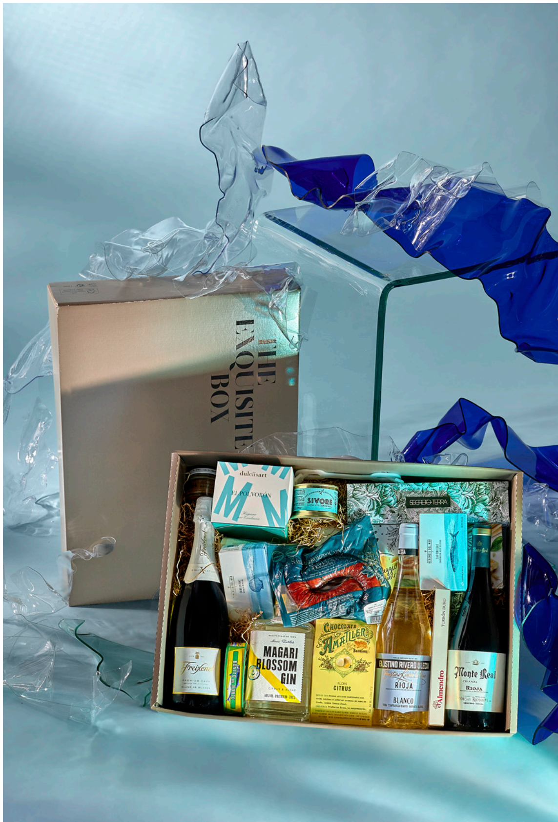
LOTE THE EXQUISITE BOX 309 REF. 4D2CTEB309