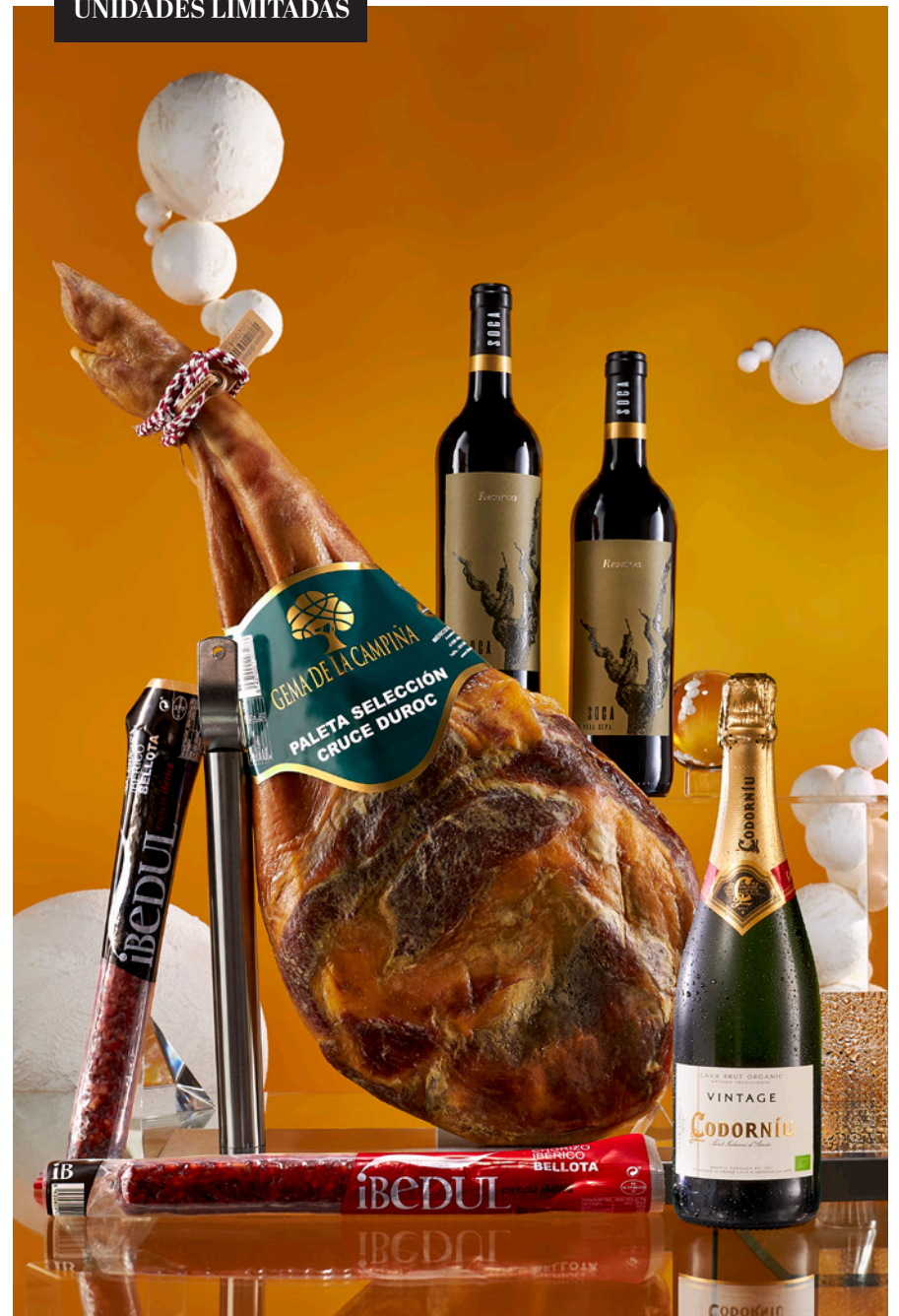
REF. 4D2C201J_ESTUCHE JAMONERO 201J