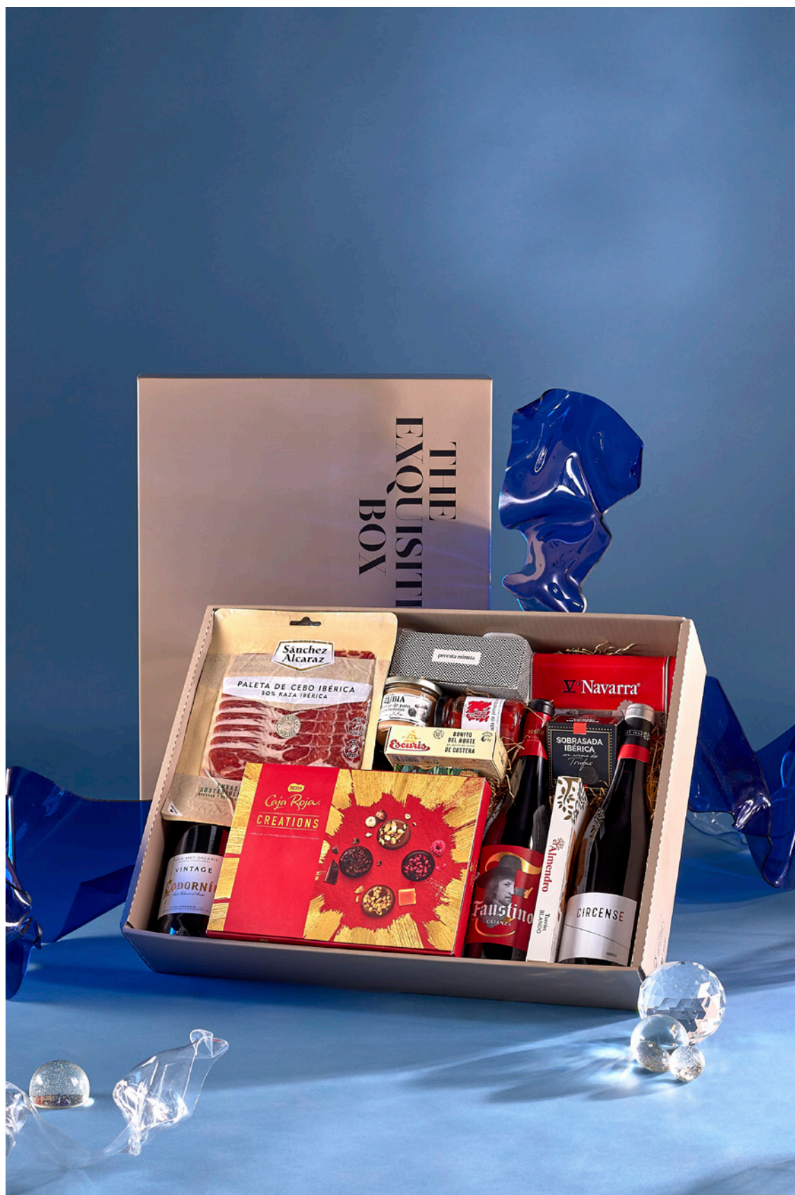
LOTE THE EXQUISITE BOX 313 REF. 4D2CTEB313