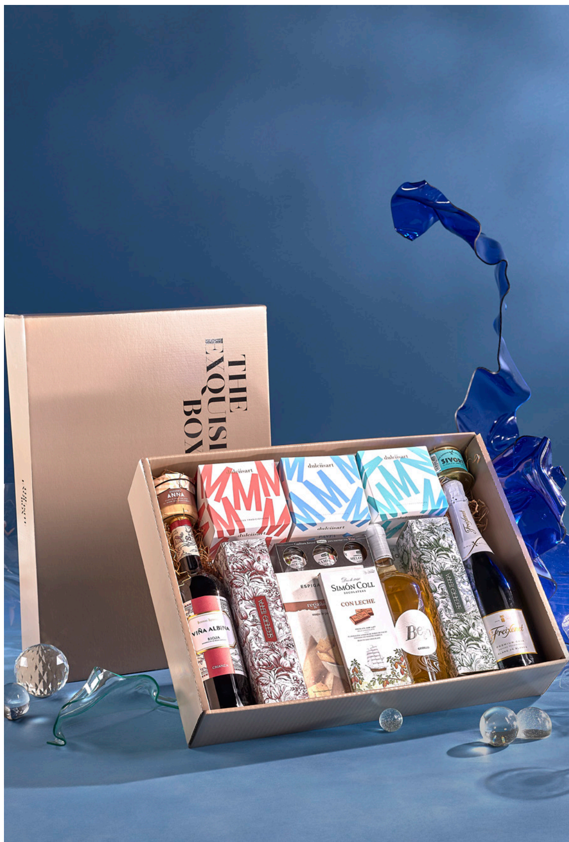
LOTE THE EXQUISITE BOX 320 REF. 4D2CTEB320