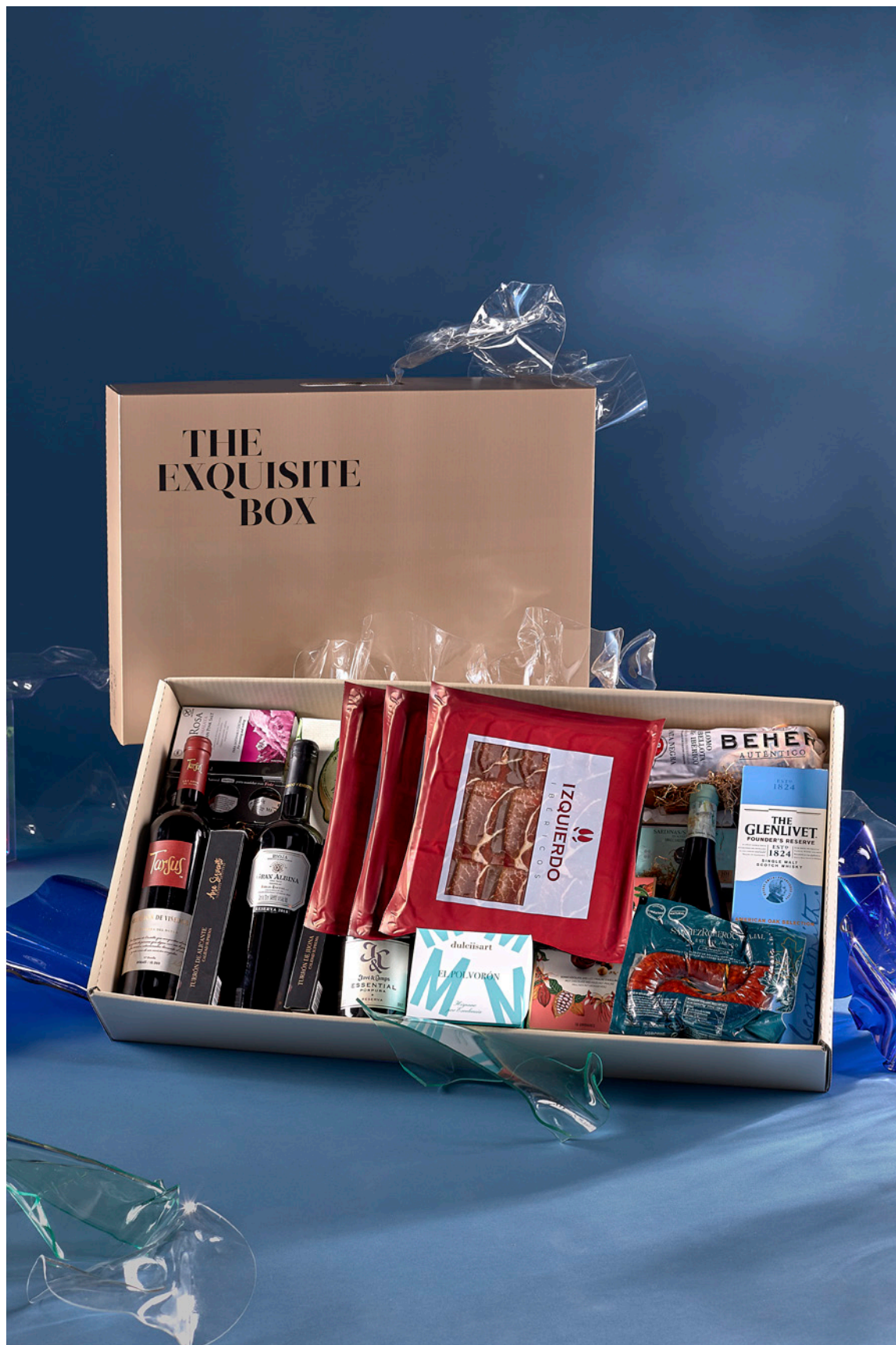
LOTE THE EXQUISITE BOX 304 REF. 4D2CTEB304