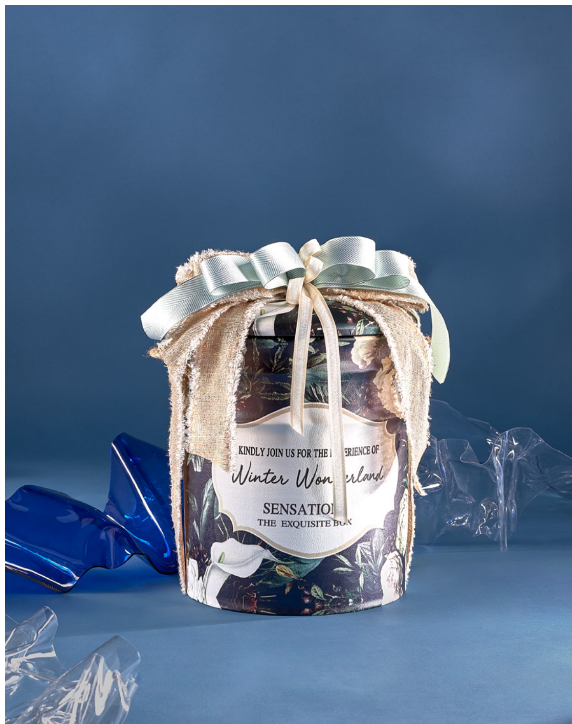
BAÚL THE EXQUISITE BOX 310 REF. 4D2CTEB310