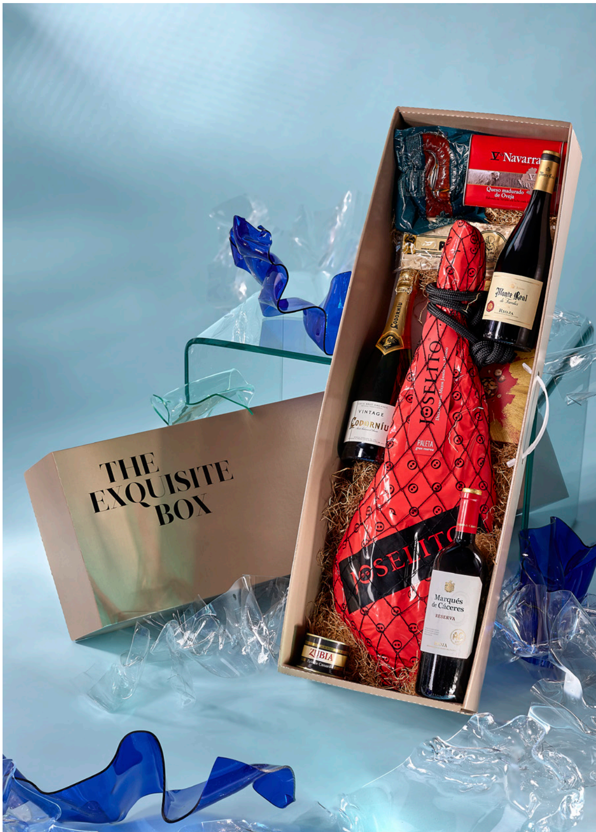
JAMONERO THE EXQUISITE BOX 303 REF. 4D2CTEB303