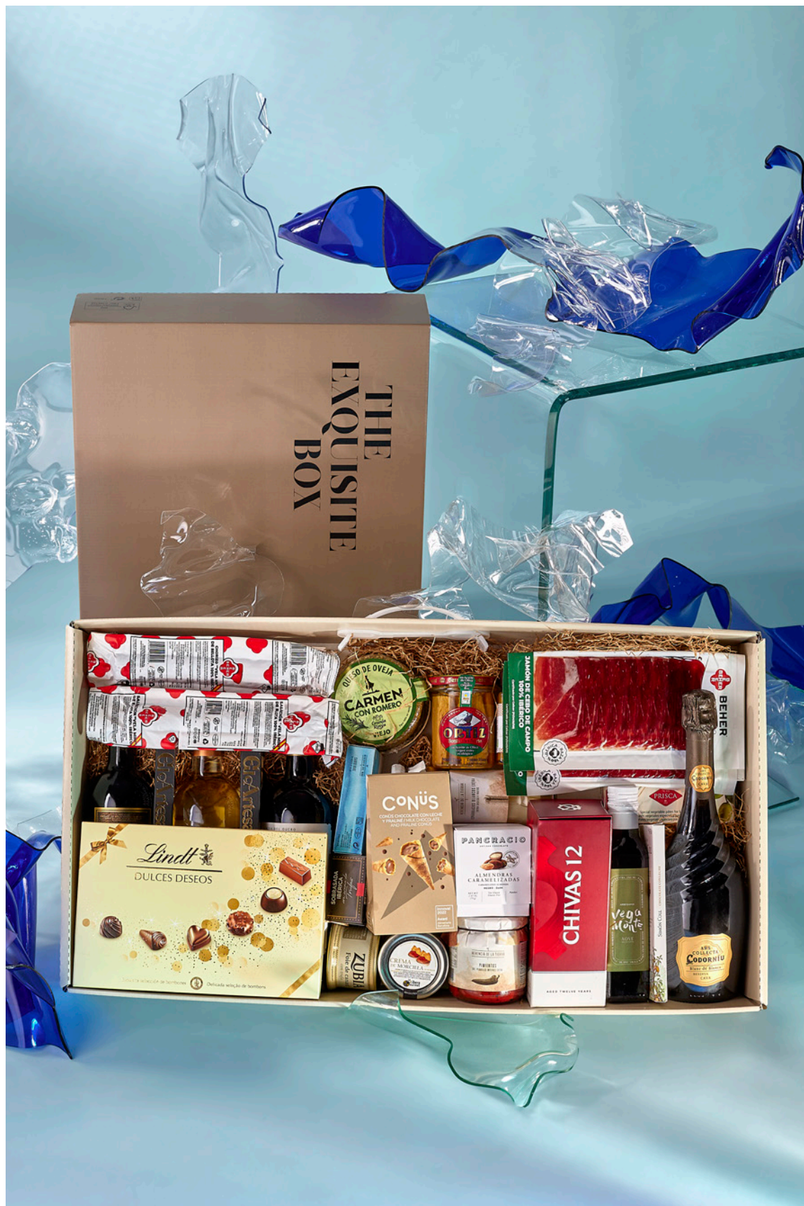
LOTE THE EXQUISITE BOX 305 REF. 4D2CTEB305