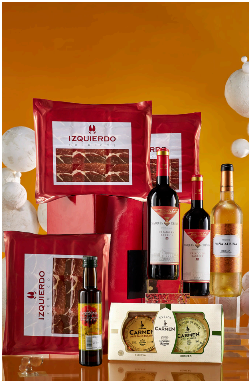
REF. 4D2C200J_ESTUCHE JAMONERO 200J