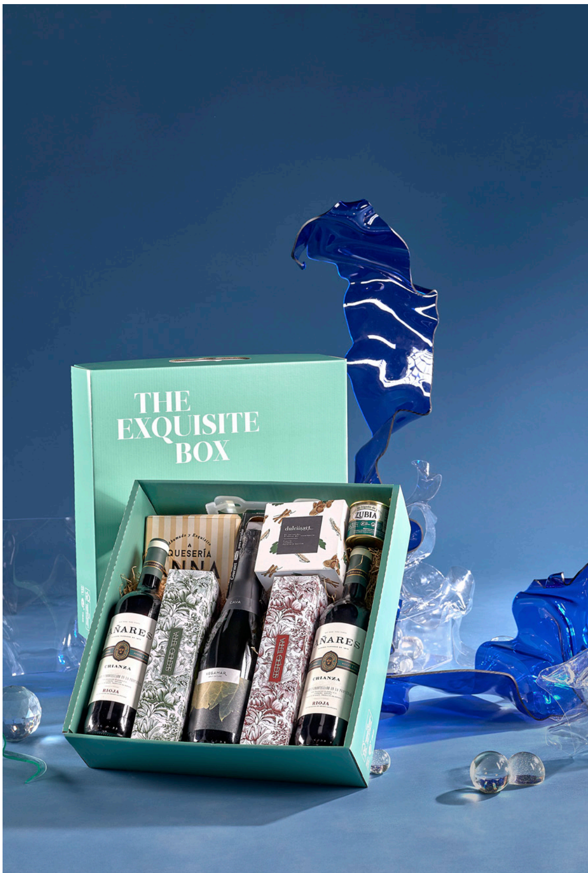
LOTE THE EXQUISITE BOX 322 REF. 4D2CTEB322