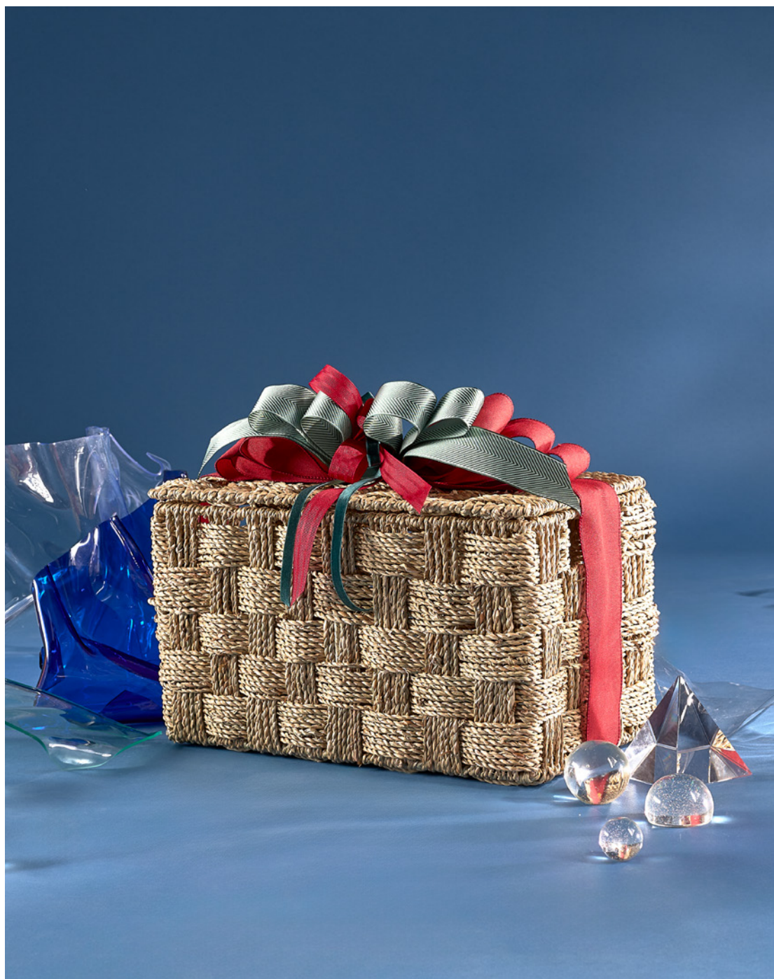
BAÚL THE EXQUISITE BOX 318 REF. 4D2CTEB318

Incluye baúl decorado y caja protectora de embalaje.