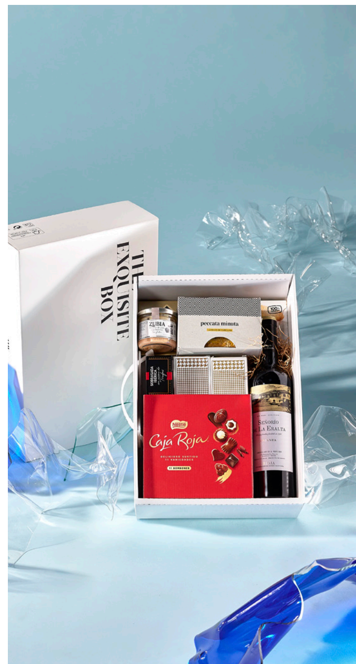
LOTE THE EXQUISITE BOX 326 REF. 4D2CTEB326