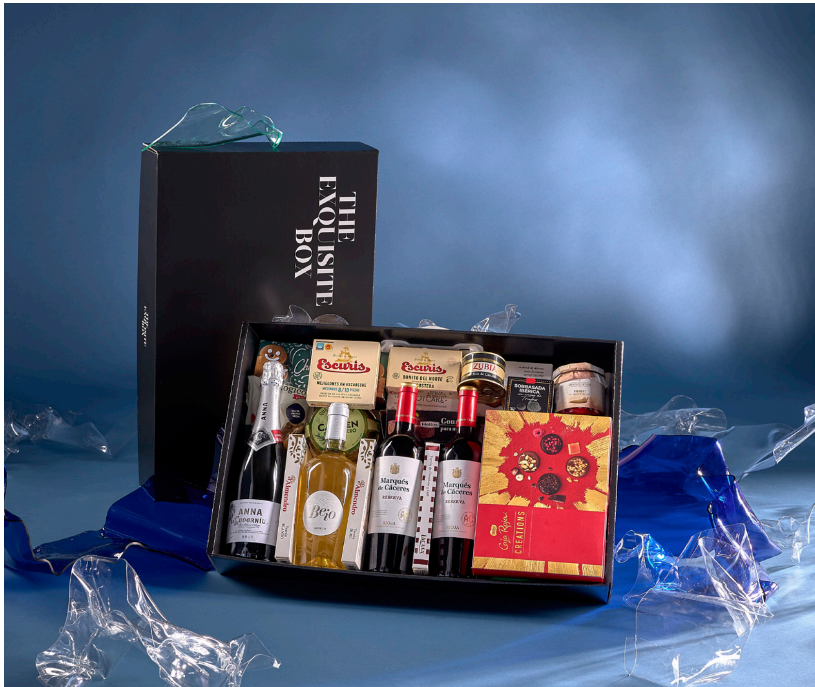
LOTE THE EXQUISITE BOX 307 REF. 4D2CTEB307